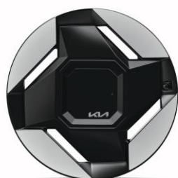
19" felgi aluminiowe (Earth)